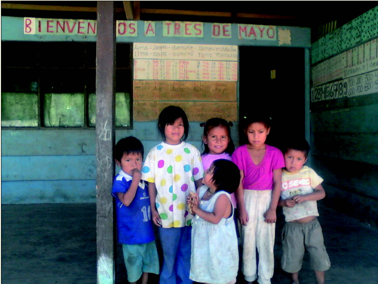
Los niños de Tres de Mayo del Ichoa posan frente a su pequeña escuelita, dando la bienvenida a la Brigada de la consulta.