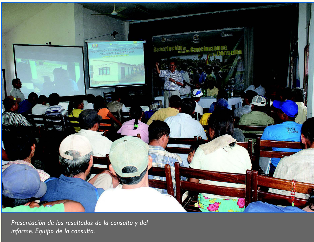
Presentación de los resultados de la consulta y del informe. Equipo de la consulta.

Previamente, para la concurrencia a este Acto, la Subcentral Sécore y el Conisur convocaron a sus afiliados a participar del análisis y aprobación final de los acuerdos de la consulta.