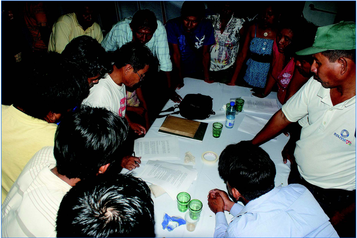
Deliberación de las autoridades comunales sobre el contenido del Acta de Suscripción de Acuerdos (Información completa en el Anexo 24).

Elementos importantes que fueron complementados al mandato de las comunidades, dado a través de sus asambleas comunales: