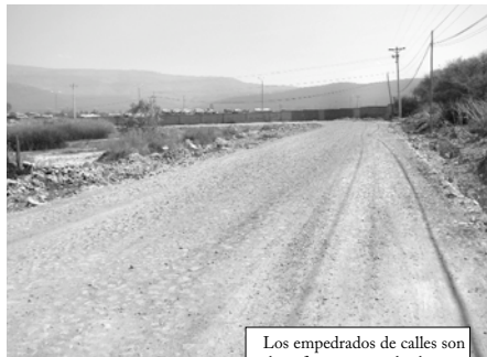
Los empedrados de calles son obras frecuentes en los barrios

Entre los problemas con los tuvo que lidiar, Alfredo Medrano señaló la dificultad de no contar con la documentación esencial como los pliegos de especificaciones, contratos y otros para coadyuvar con el control de la ejecución de las obras del Distrito.