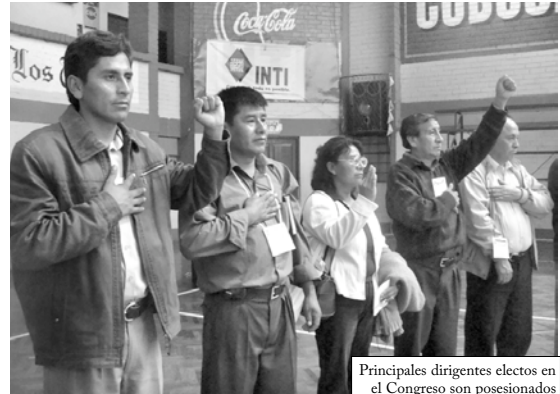
Principales dirigentes electos en el Congreso son posesionados