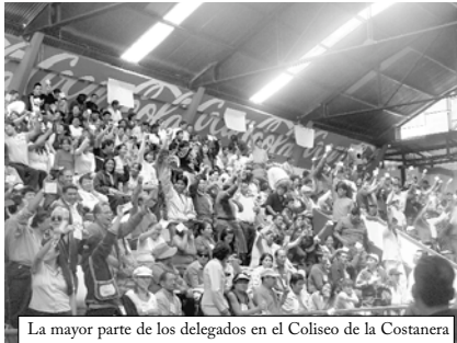
La mayor parte de los delegados en el Coliseo de la Costanera