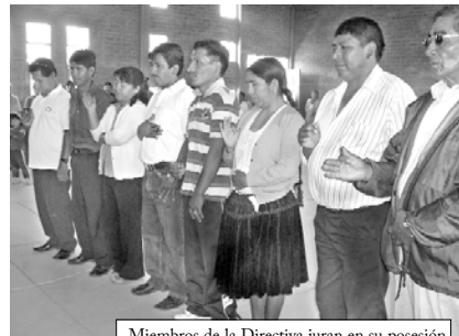
Miembros de la Directiva juran en su posesión

La posesión se realizó en ambientes de la Sede Social de la OTB, que cuenta con un importante nivel de avance. La obra se realizó con el ahorro de varios años de sus fondos de co-participación tributaria, más el trabajo comunitario.