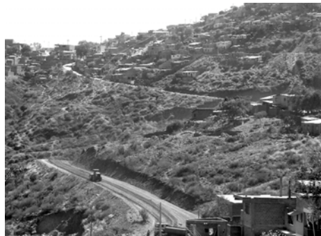
La apertura de vías en la zona del Ticti del Distrito 8