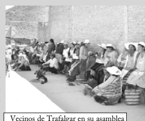
Vecinos de Trafalgar en su asamblea

Vecinos de la zona de Trafalgar, el 1° de marzo pasado en asamblea general ordinaria, procedieron a la renovación del directorio de la OTB. Los vecinos electos fueron