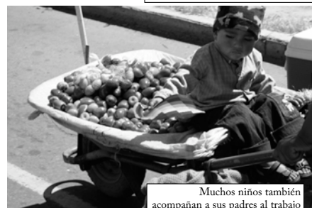
Muchos niños también acompañan a sus padres al trabajo

Grandes reservas de litio a punto de entregarse a privados