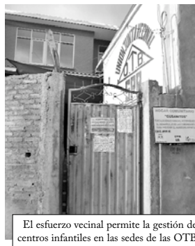
El esfuerzo vecinal permite la gestión de centros infantiles en las sedes de las OTB

Al horario de trabajo sobrepasado se deben añadir la falta de seguro social, y los más elementales derechos sociales. El incentivo económico como medio de contratación no hace más que depauperar aún mas las condiciones laborales de los habitantes de los barrios periurbanos.