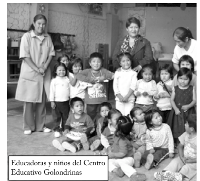
Educadoras y niños del Centro Educativo Golondrinas

El 29 de agosto del 2001 recibieron su Personería Jurídica una Asamblea y directorio. Actualmente son en Nuevo Pagador 37 los niños promedio diario que atiende el Centro y los padres es de 40 Bs.