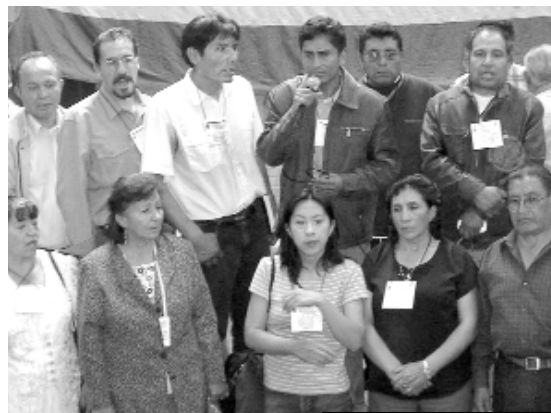
Dirigentes electos de la FEDJUVE

Intereses partidarios y la intromisión de la Alcaldía y la Prefectura en su pugna por copar la dirección de la FEDJUVE terminaron limitando el Congreso nada más que a la elección de nuevos directorios, dejando el debate vecinal de lado y postergando la recomposición del movimiento vecinal, ahora más restringido a lo dirigencial, a expensas de las mismas autoridades y partidos y sin el protagonismo de las bases vecinales y sus propuestas.