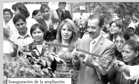
Inauguración de la ampliación del Centro de Salud de Pagador