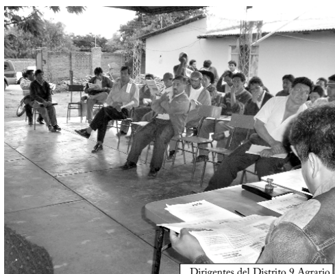
Dirigentes del Distrito 9 Agrario