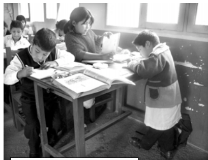
La falta de mobiliario obliga a los niños a hacer peripecias para aprender

“La gestión anterior nos dijeron que a nuestra unidad iba a llegar 21 computadoras” señaló un padre de familia, quien nos dijo también que de las computadoras prometidas sólo llegaron los muebles pero incompletos. “Los padres de familia nos apresuramos en construir la sala de computación y cuatro aulas con aportes propios, sin ningún apoyo de la Alcaldía (...) no permitiremos que la tardanza de la entrega de estos equipos se convierta en una campaña