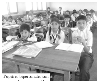
Pupitres bipersonales son usados por tres niños

Las Unidades Educativas San Antonio del Distrito 9 y San Francisco del Distrito 14 desde hace años atrás sobrepasaron su capacidad sin que las Autoridades atiendan la necesidad de ampliación, ante esta situación y la falta de mobiliario y equipamiento los estudiantes se ven obligados a pasar clases en condiciones que están fuera de toda consideración pedagógica.