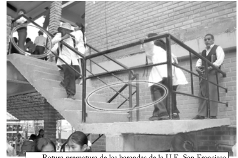
Rotura prematura de las barandas de la U.E. San Francisco