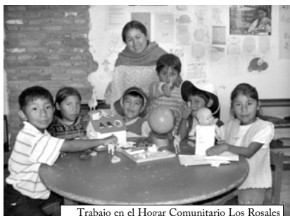
Trabajo en el Hogar Comunitario Los Rosales

instanciales autoridades son sin duda las r los fines que justifican su existencia.