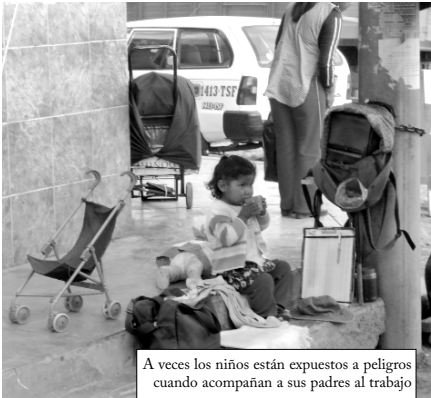
A veces los niños están expuestos a peligros cuando acompañan a sus padres al trabajo