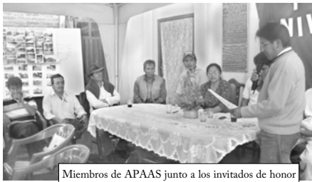
Miembros de APAAS junto a los invitados de honor

Con el respaldo de la cooperación y el esfuerzo mancomunado de dirigentes y vecinos el 31 de marzo de 1990 fue fundada oficialmente la Asociación de Producción de Agua y abastecimiento de Agua APAAS que desde la fecha tiene la titánica tarea de transportar la mejor agua a los hogares de Villa Sebastián Pagador.