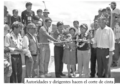
Autoridades y dirigentes hacen el corte de cinta

Vecinos y dirigentes de la OTB Integración el día domingo 5 de abril festejaron el octavo aniversario con varias actividades, entre las que destacó el campeonato relámpago inter manzanos en el que participaron niñas, niños, señoras y adultos.