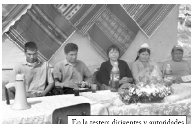
En la testera dirigentes y autoridades

Finalmente los vecinos todos, se sirvieron el plato preparado para la fecha y cerraron el festejo con un campeonato relámpago con los niños y jóvenes del barrio.