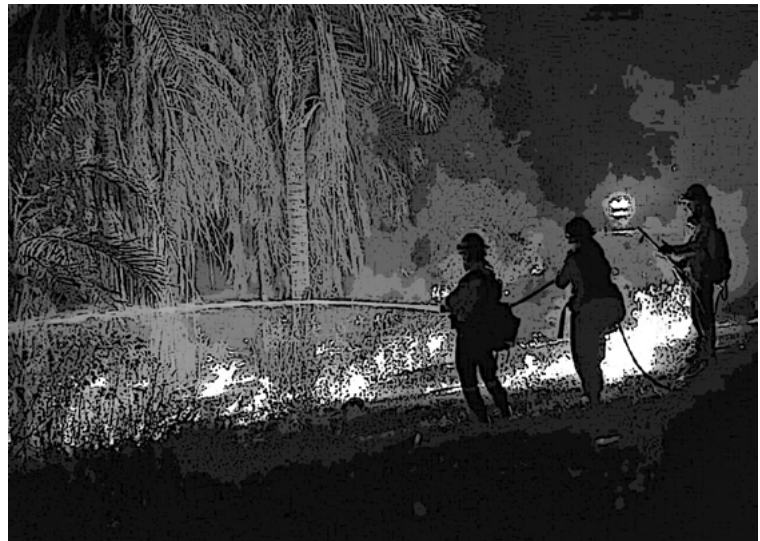
Gobernación de Santa Cruz

Las prácticas económicas del agronegocio y sus actores se caracterizan por no proteger y respetar los derechos humanos. Las extremas consecuencias de la devastación ambiental y las graves violaciones de derechos, sin que se prevean medidas de prevención ni de investigación seria, sanción y reparación, son la expresión más patente de actuaciones poco empáticas con el respeto a los derechos de las personas, de las comunidades y de la naturaleza.